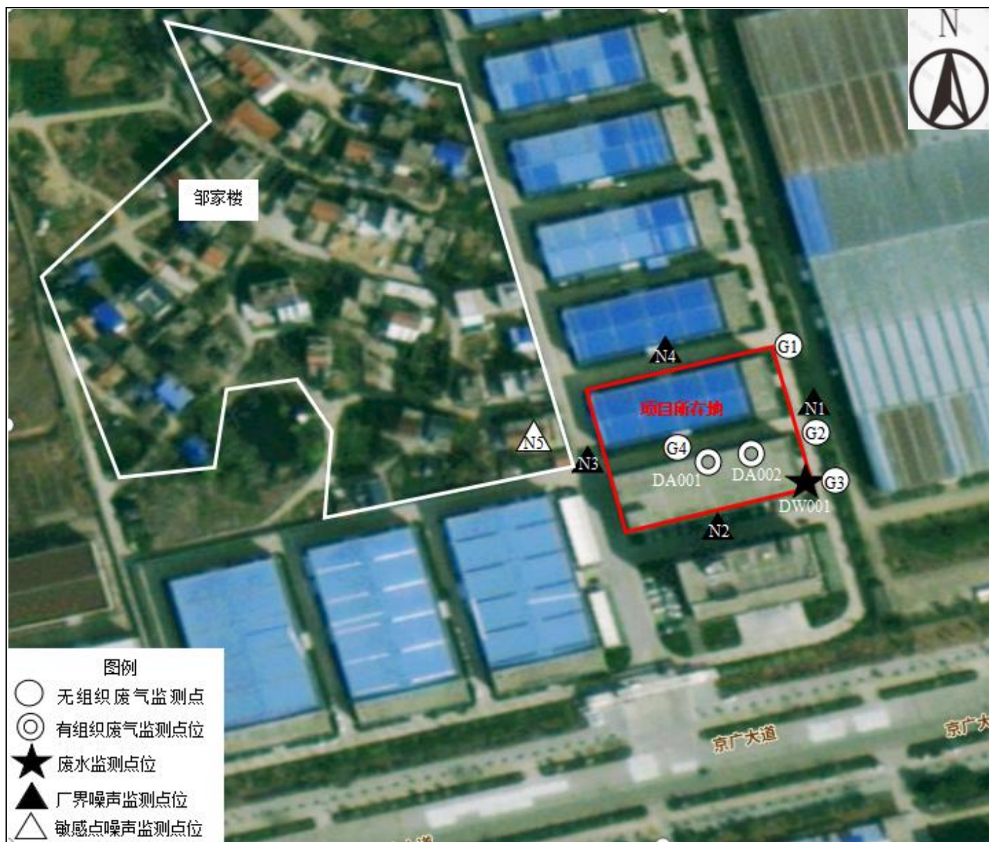
附图4 项目验收监测点位图