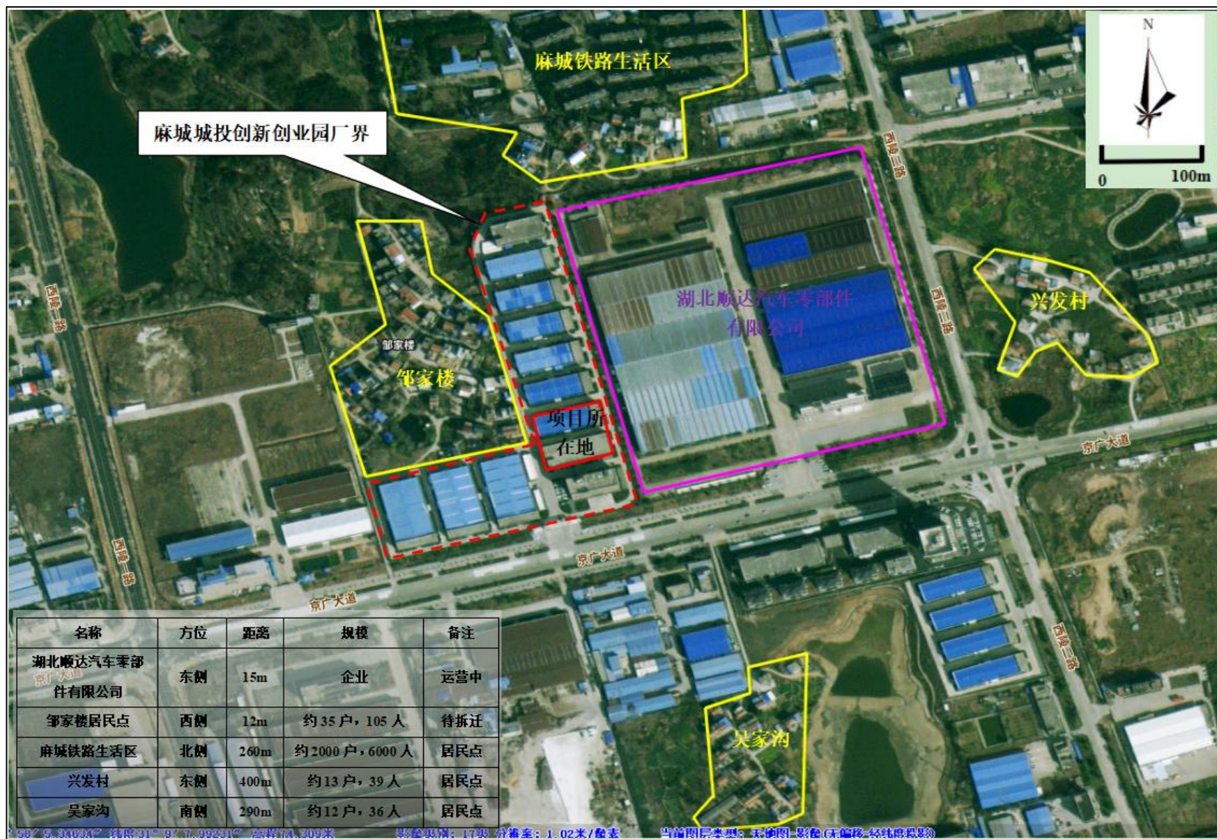
附图 2 项目周边关系示意图