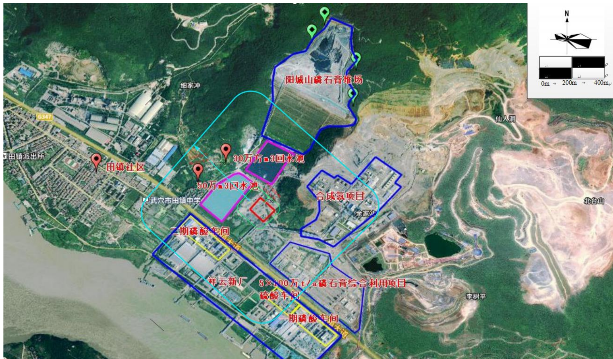
附图4 项目周边环境保护敏感示意图