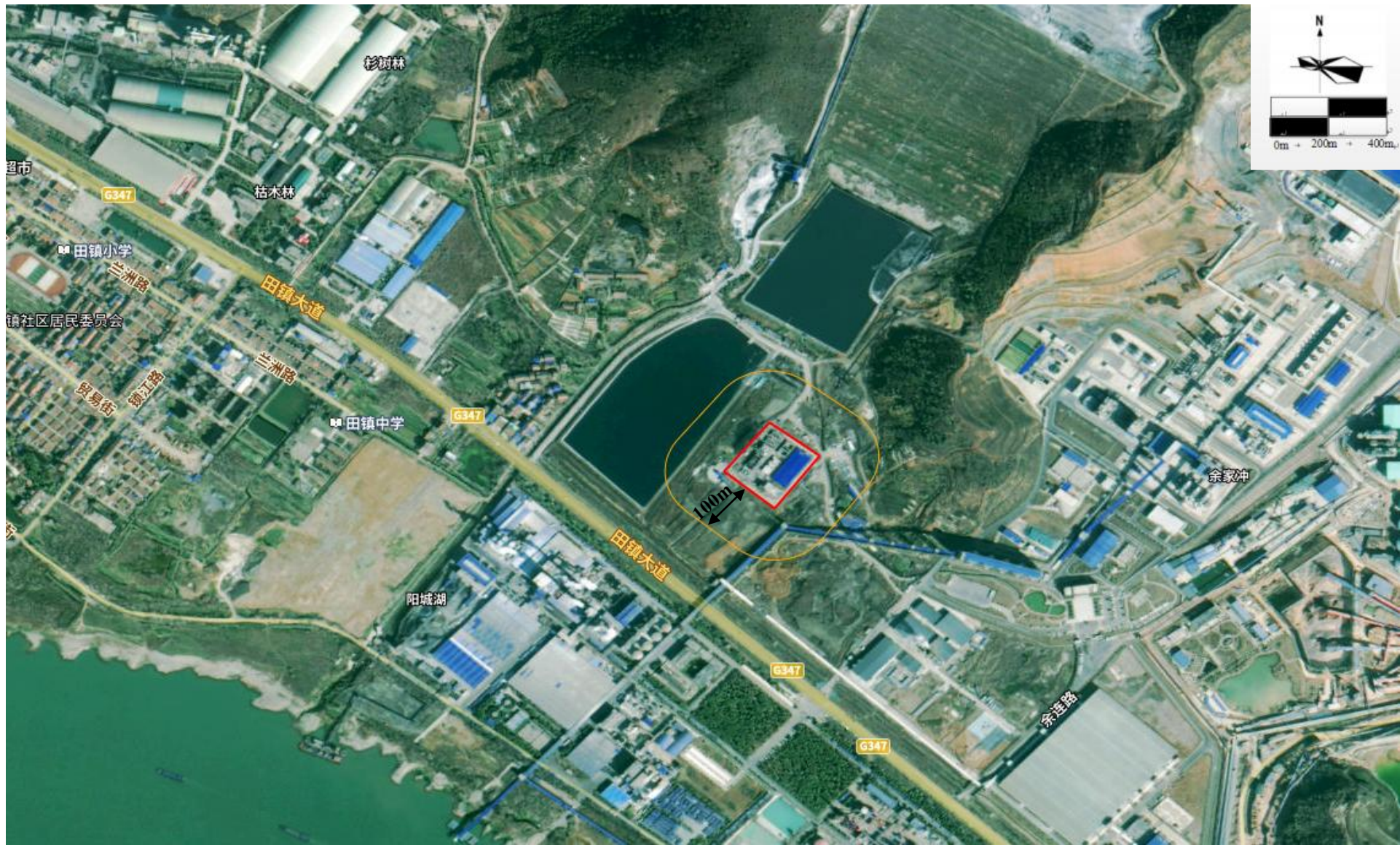
附图 6 项目卫生防护距离包络线图