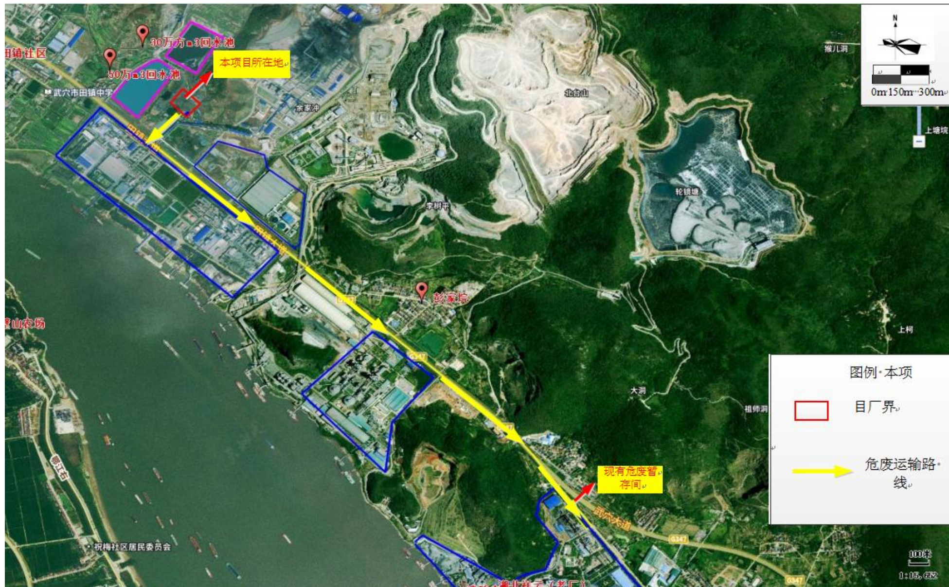
附图5 项目危险废物入库线路图