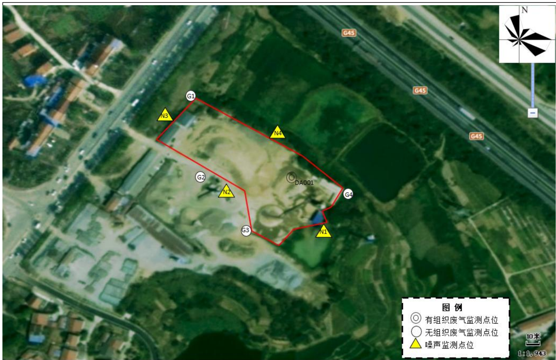
附图 5 项目监测点位示意图