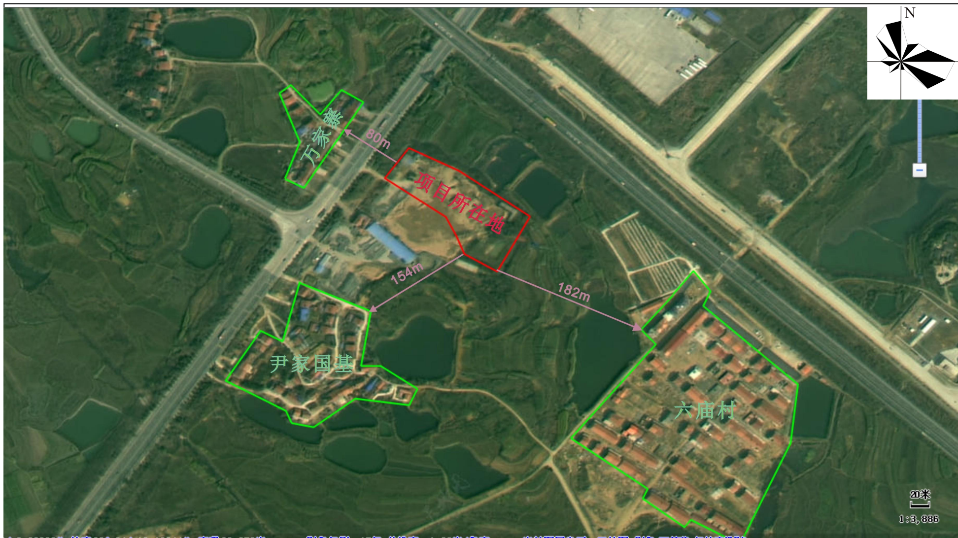
附图 2 项目周边环境示意图