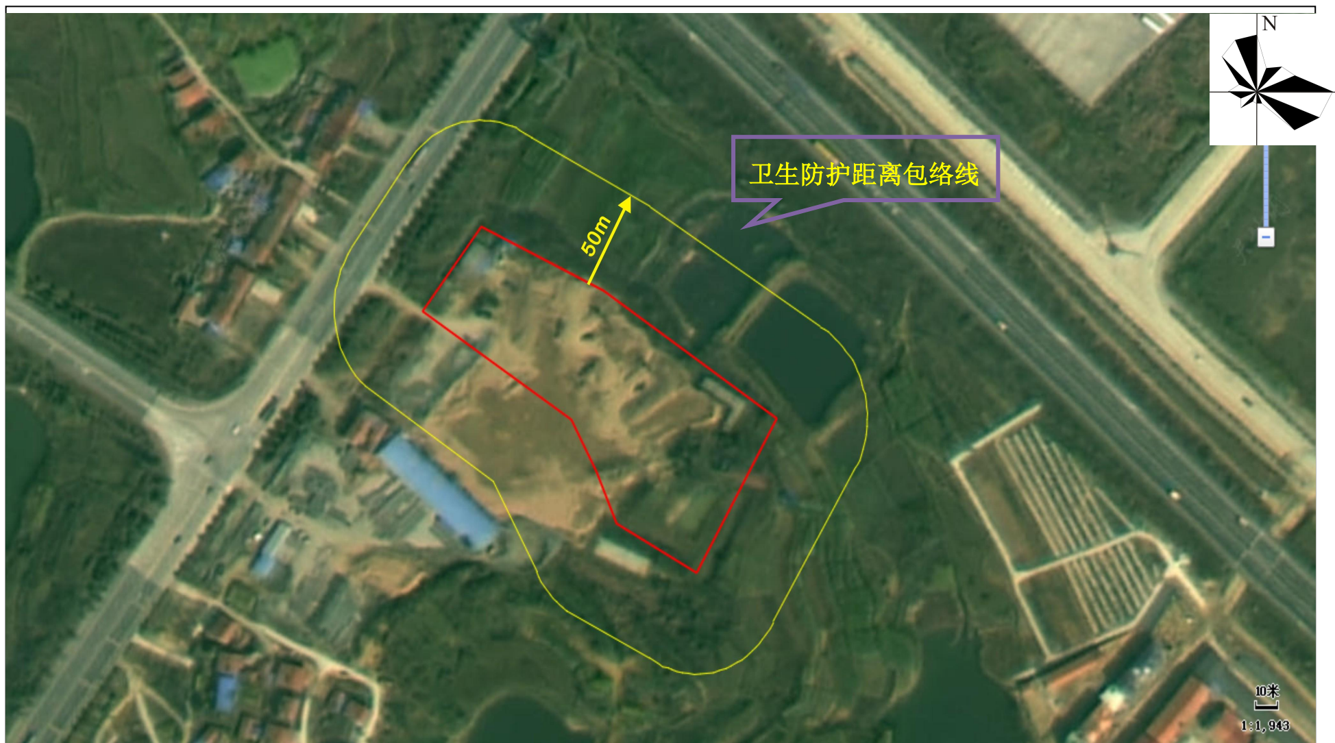
附图 4 项目卫生防护距离包络图