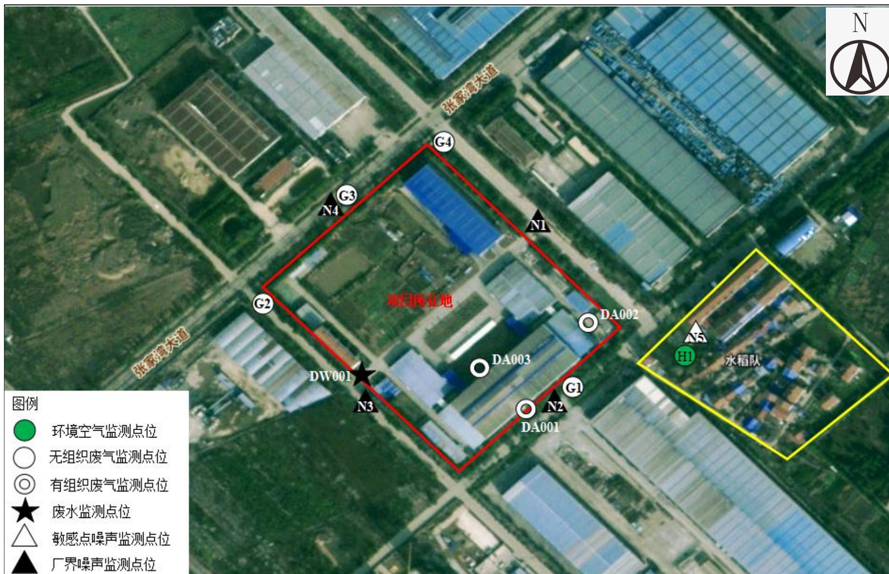
附图 4 项目监测点位图