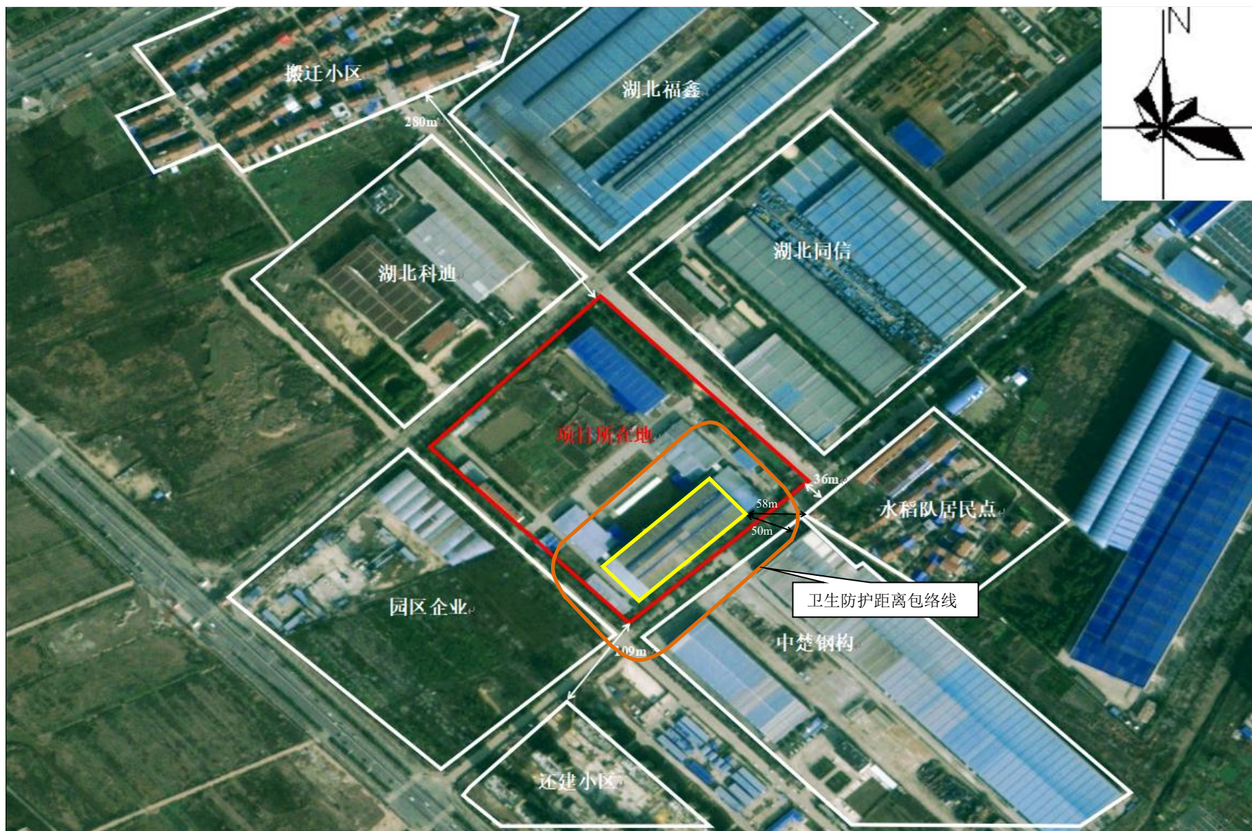
附图5 项目卫生防护距离包络线图