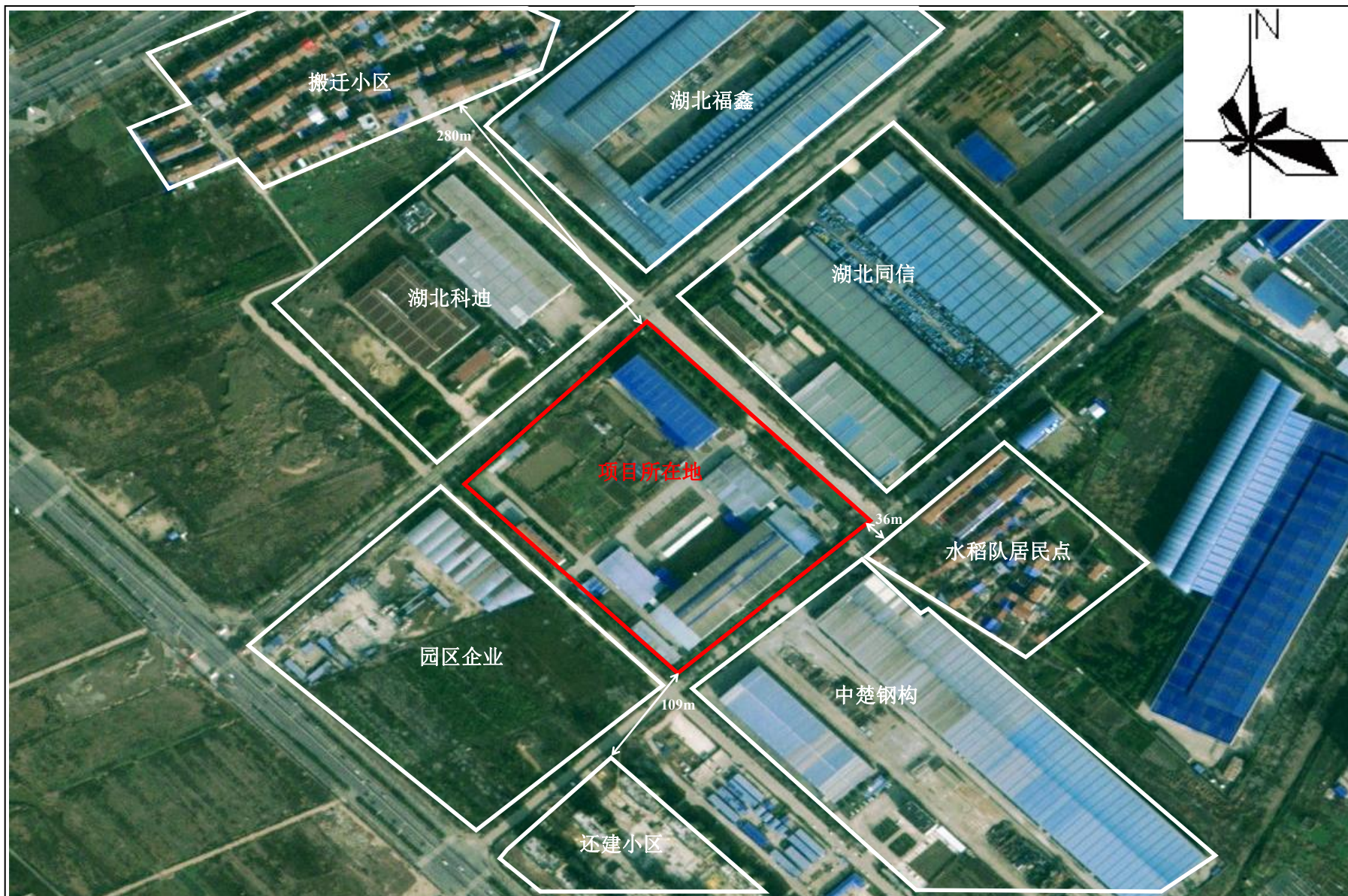
附图 2 项目周边关系示意图