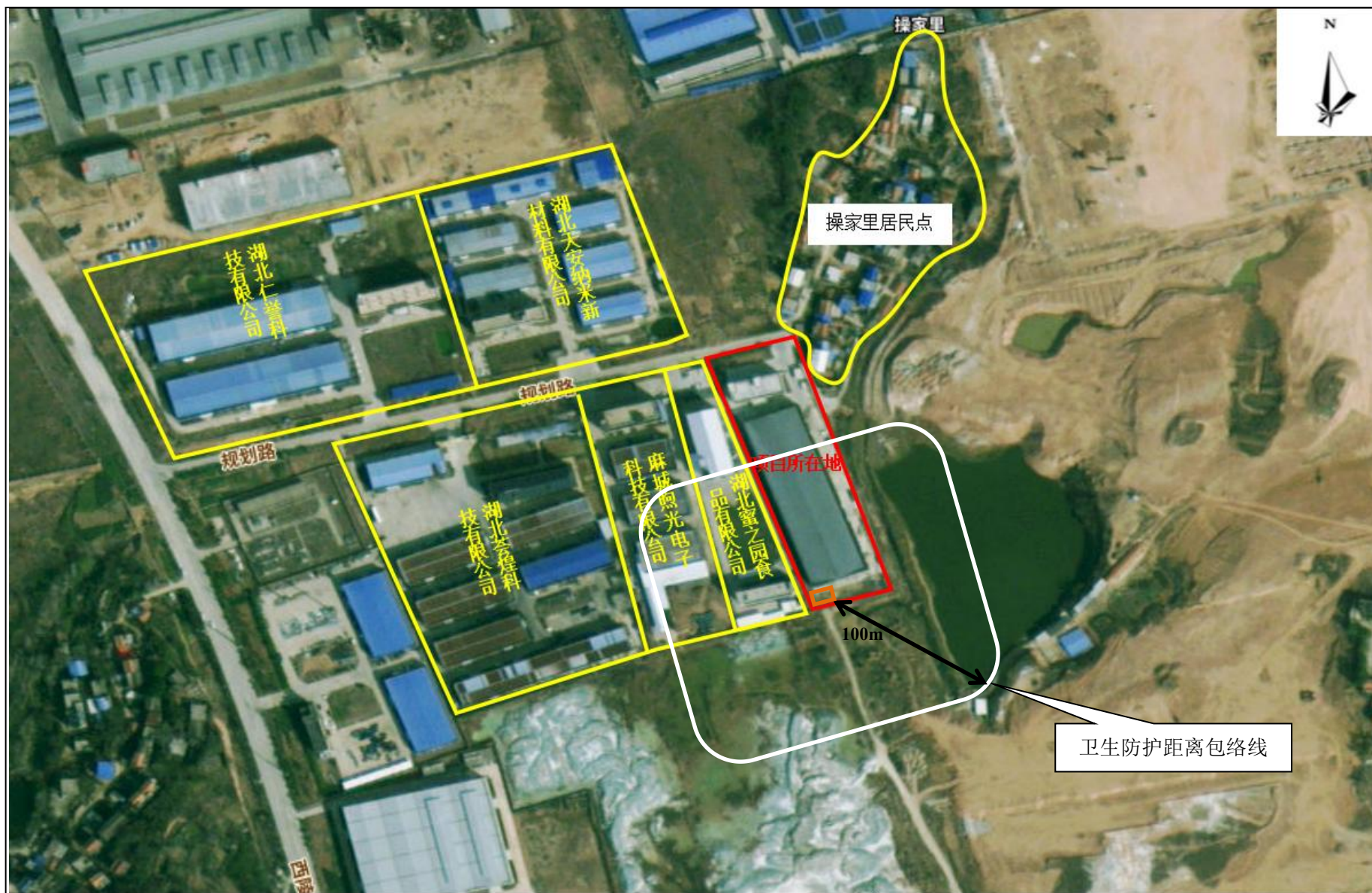
附图 5 项目卫生防护距离包络线图