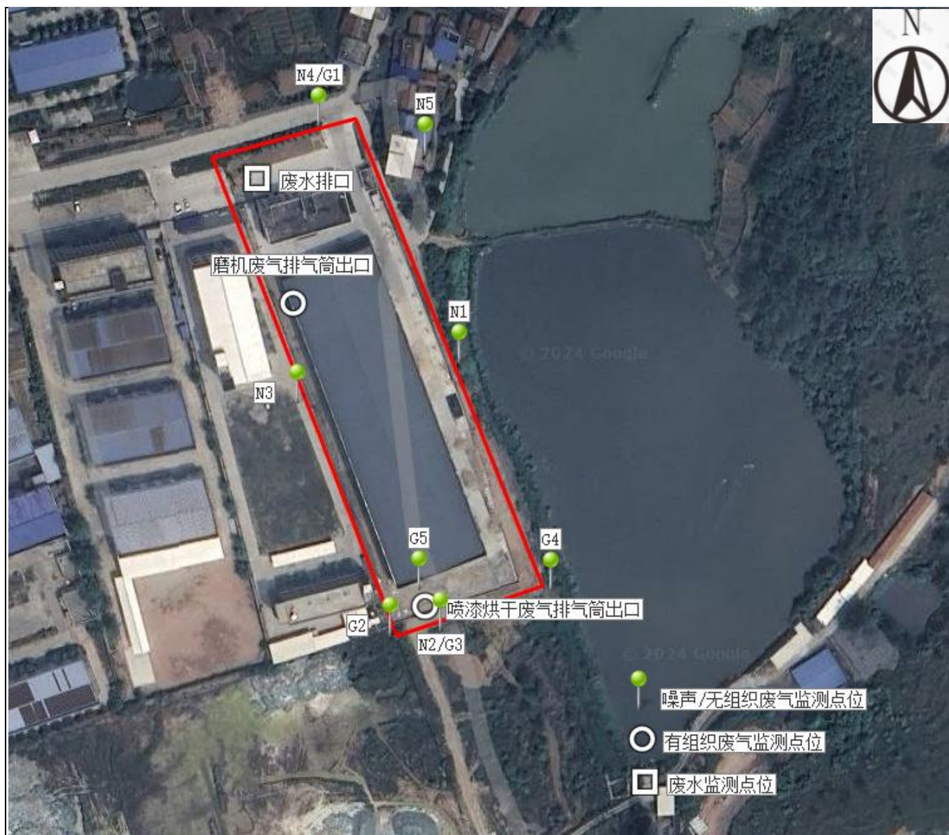
附图 4 项目监测点位图