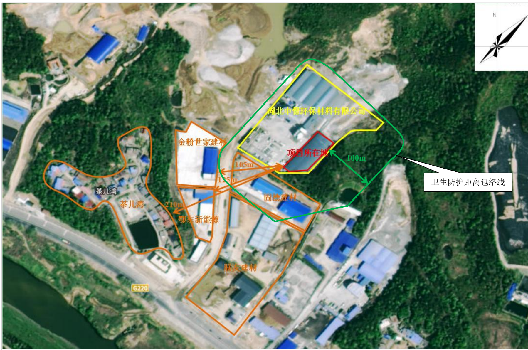
附图6 项目卫生防护距离包络线图