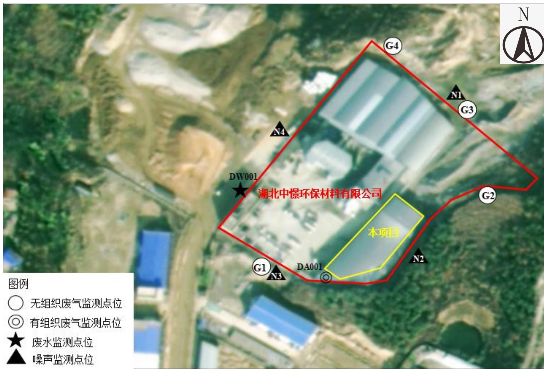
附图 5 项目监测点位图