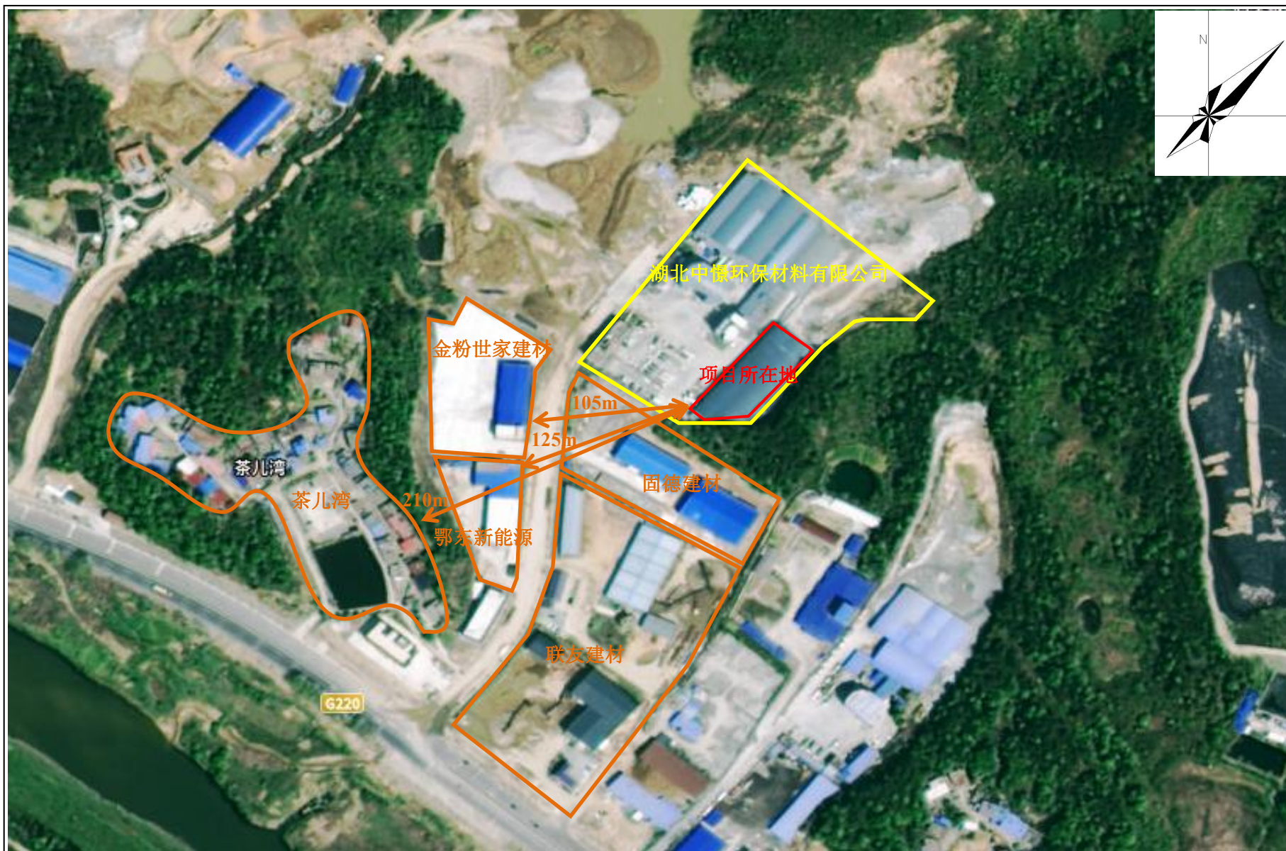
附图2 项目周边关系示意图