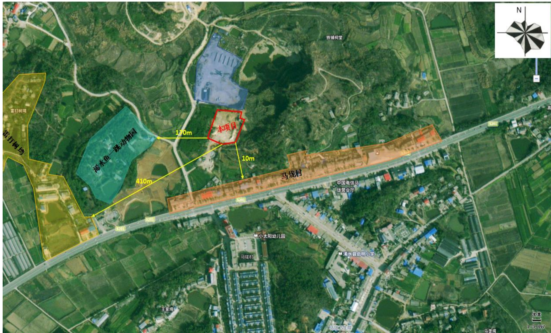
附图 2 项目周边关系示意图