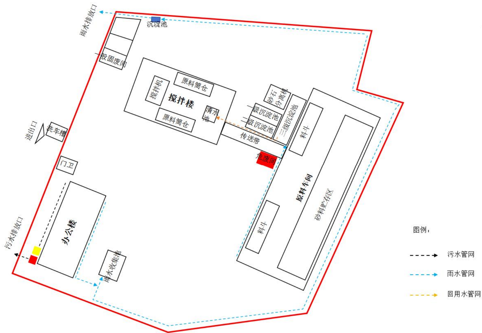
附图 3 项目总平面布置图及雨污管网图