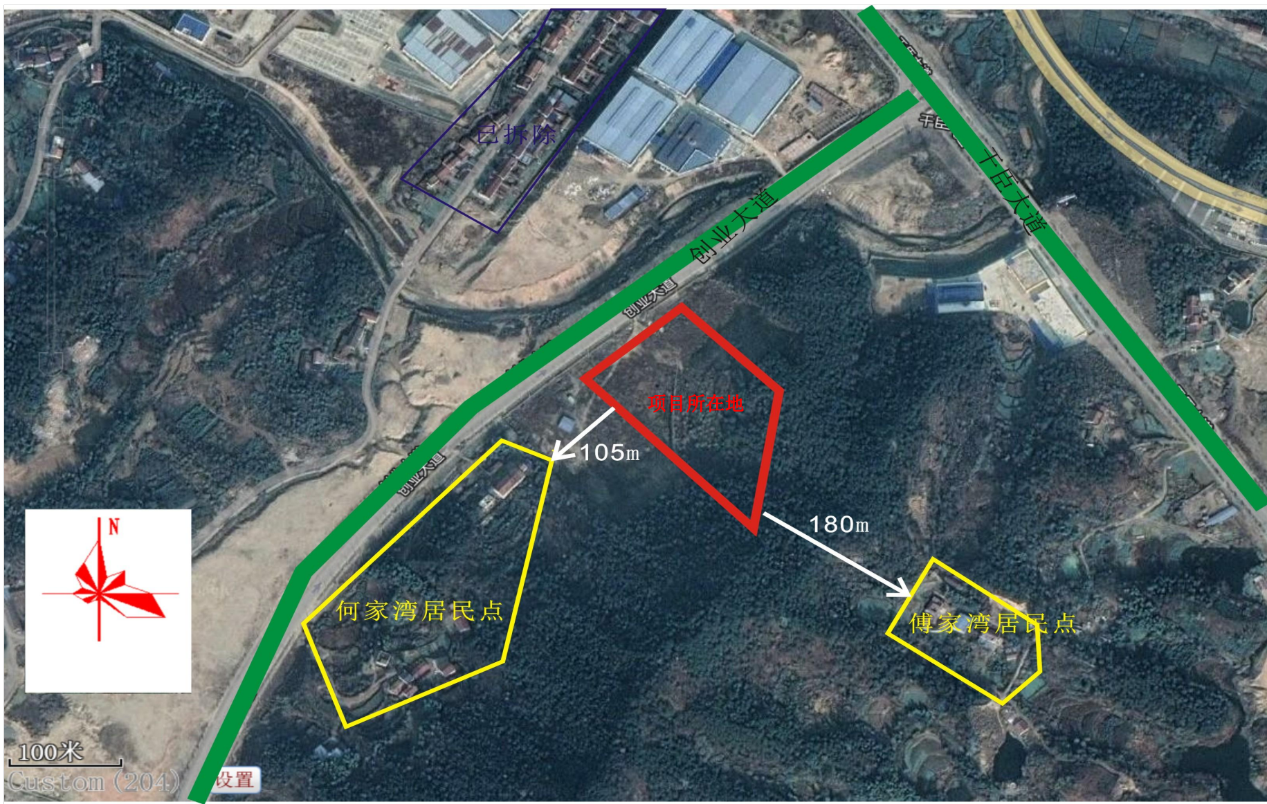
附图2 项目周边关系示意图