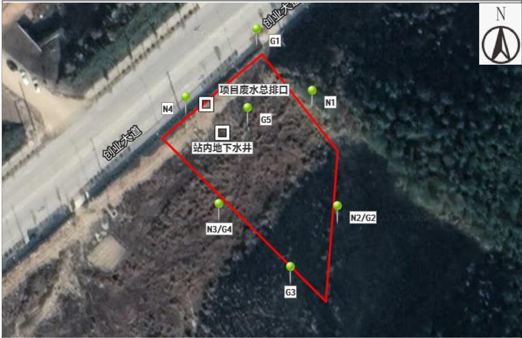
附图 4 项目监测点位图