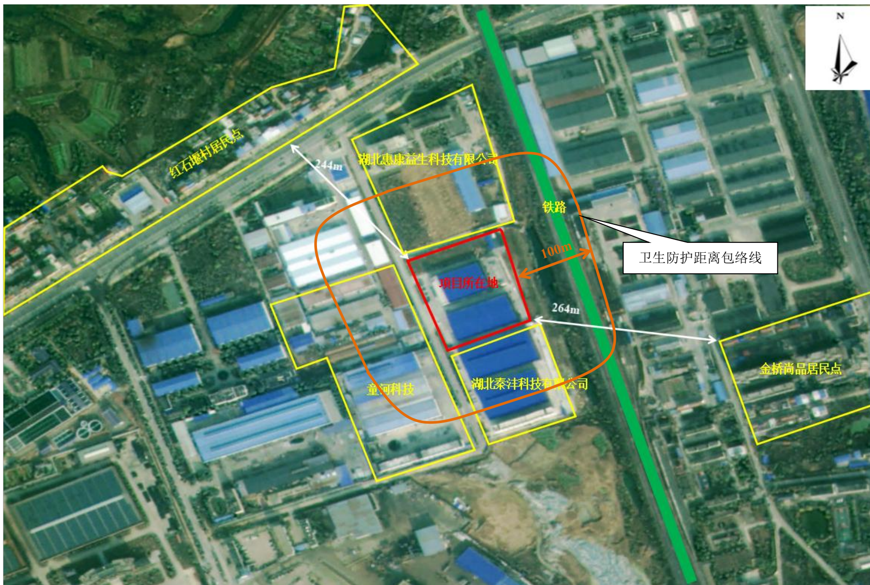
附图5 项目卫生防护距离包络线图