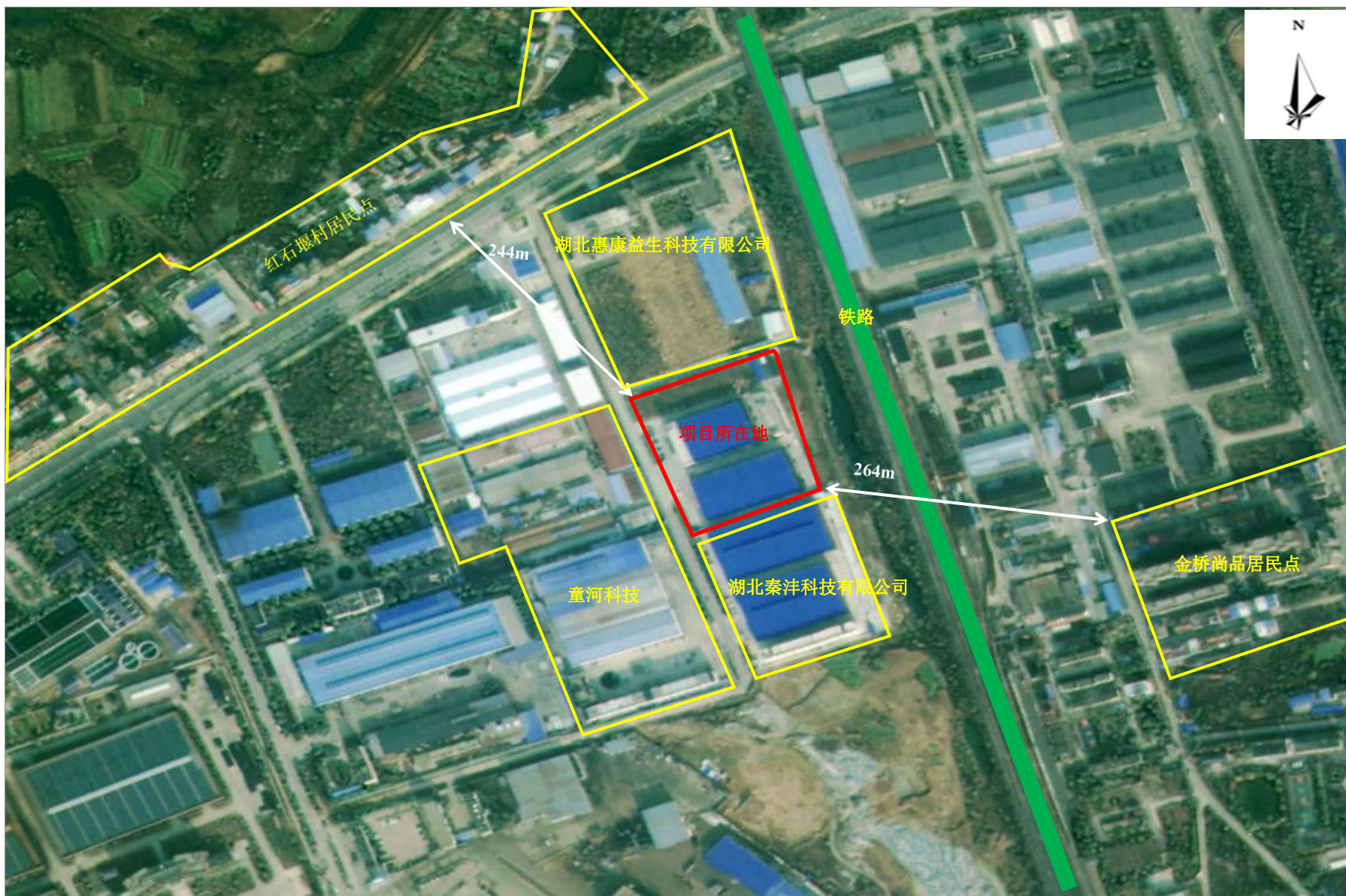
附图2 项目周边关系示意图